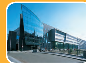
campus reepkaai Reepkaai 4