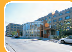
campus loofstraat Loofstraat 43