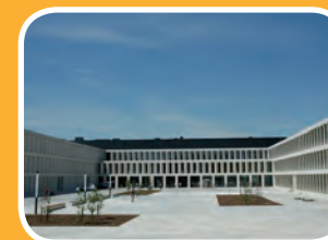
campus kennedylaan Pres. Kennedylaan 4